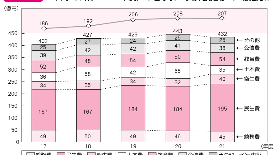
グラフ3 5年間(平成17~21年度)の各予算・決算額推移(一般会計)