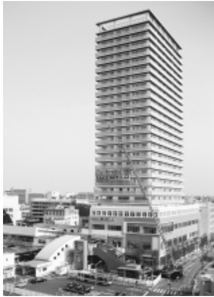
2・3階フロアに東村山駅西口市民ステーション「サンパルネ」がオープンする西口再開発ビル

10月1日(木)から、東村山駅西口地区再開発ビル内の公益施設である市民ステーション「サンパルネ」が全面的にオープンします。 市では、「サンパルネ」のオープン記念として、市民の皆さんが企画・運営する記念イベントを10月中旬に開催します。