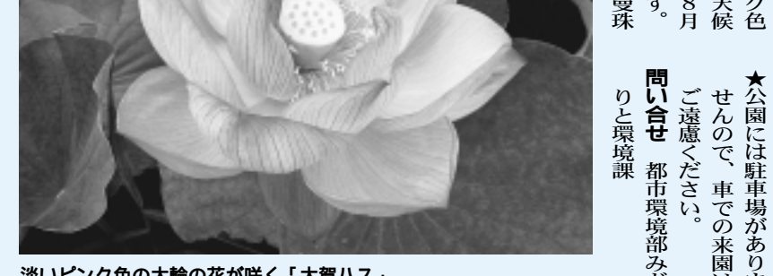
淡いピンク色の大輪の花が咲く「大賀ハス」