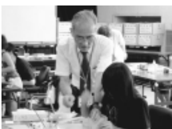
豆本づくりの様子

親子で図書館の仕事を経験 してみませんか? 日程・場所・定員 ○中央図書館 8月7日(金) ○各回先着4組 ○富士見図書館・廻田図書館 8月29日(水) 各回先 着2組 ○萩山図書館・秋津図書館 8 月31日(金) 各回先着 2組