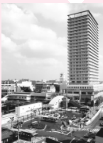
東村山駅西口の様子(8月3日現在)