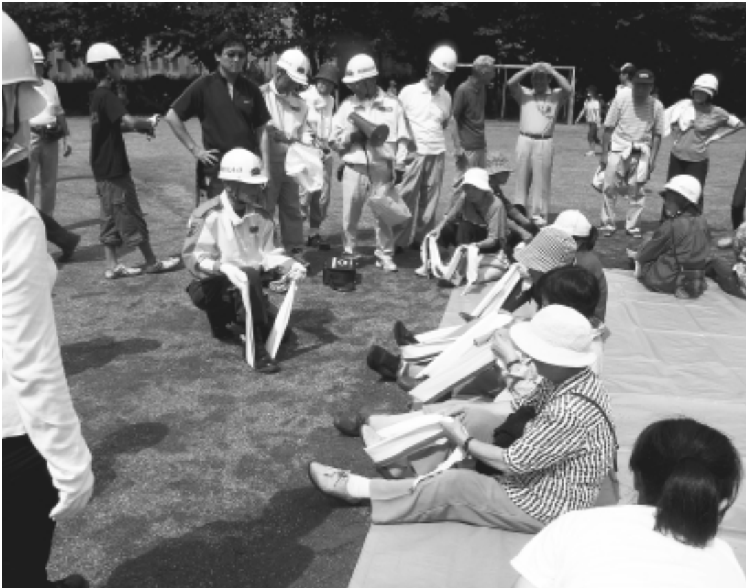
昨年の総合震災訓練の様子

日時 9月5日(土)午後1時～3時 場所 東村山第二中学校 (久米川町2-4-1) 対象 久米川町在住のかた