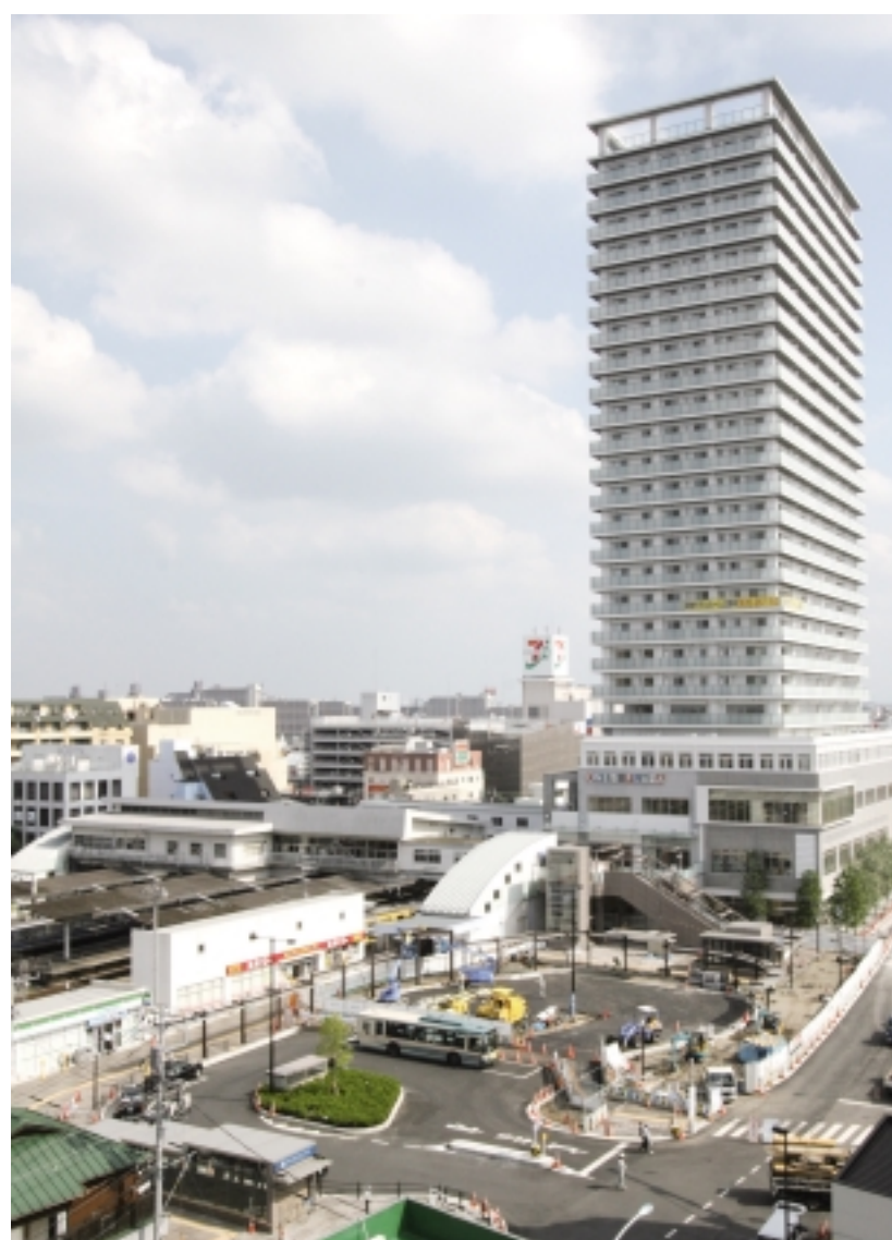
東村山駅西口の様子（8月3日現在）

東村山駅西口駅前広場が8月末に完成します。この西口駅前広場の実現は、駅の利用者や周辺住民の約半世紀におよびる願望であり、周辺地権者の理解と協力を得て事業化できたことに対し、ここに改めて感謝申し上げます。また、工事中は周辺住民の皆様にご不便をおかけしましたことをおわび申し上げます。