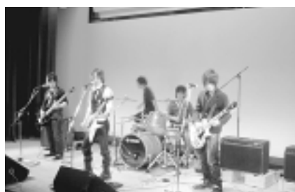
ヤングライブの様子

「富士見町5-4-51」で配布します。 問い合わせ 富士見児童館(☎397・1152)