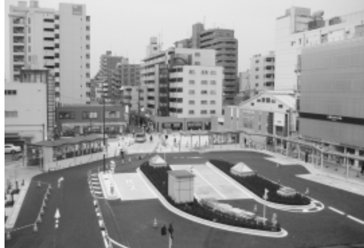
久米川駅北口の様子(3月下旬)