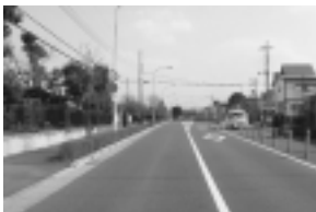
都市計画道路 3・4・5号線

1億7,348万円 都市計画道路3・4・5号線の都道226号線から出水川までの640メートルの整備、平成21年度~27年度までの7か年事業