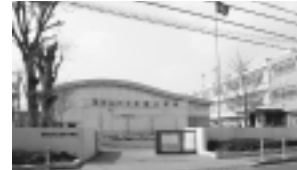
耐震補強される 化成小学校

4億2,667万円 化成小1億9,762万円、回田小4,507万円、大岱小屋内運動場9,258万円、秋津小屋内運動場9,140万円