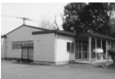
改築される児童クラブ 青葉分室

3億4,292万円 青葉分室8,713万円、化成分室7,037万円、久米川分室5,957万円、秋津東分室9,920万円、東萩山分室2,665万円