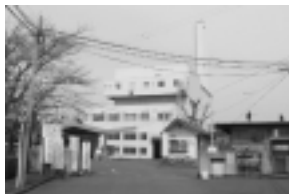
延命化が図られる ごみ焼却施設

8億4,665万円 既存施設の延命化を図るための事業、平成22・23年度の2か年事業(全体事業費16億3,322万円)