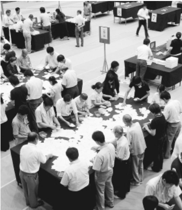
スポーツセンターでの開票風景

7月11日(日)は参議院議員選挙の投票日です。 この選挙は、これからの国政の担い手を決める大事な選挙です。 貴重な一票を大切に、必ず投票しましょう。