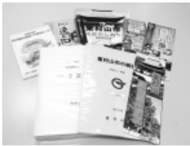
情報コーナーにある資料の一部