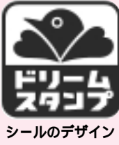
シールのデザイン

10月1日(金)から、市内加盟店(のぼり旗のある店)で買い物をする時、100円ごとに一枚「シール」がもらえます。 台紙にシール40枚をはると加盟店で500円のお買い物券として利用できるほか、 台紙の枚数に応じて各種イベントに利用できます。 各種イベント ○現金大抽選会 ○日帰りバス旅行 ○ホテル食事券 ○遊園地等招待 ほか ※詳細は全戸配布される9月15日発行の商工会の機関紙「ゆうYOU」でお知らせします。 問い合わせ 東村山市商工会 (☎394・0511)