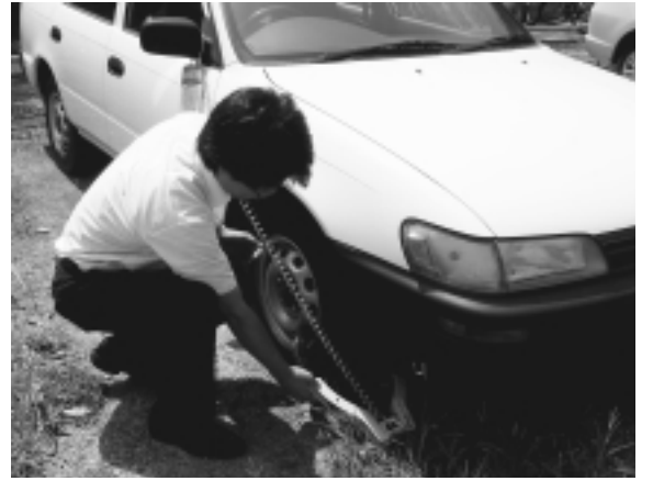
自動車のタイヤロックのようす

市では、平成22年1月に策定した市税等収納率向上基本方針に基づき、自主納付の推進、滞納整理の強化を2本の柱として市の自主財源である市税の財源確保に努めていきます。