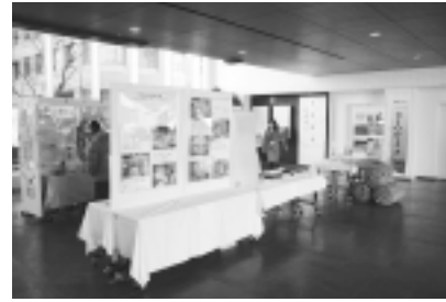
給食展示会のようす

当市では、昭和32年に小学校2校で学校給食を開始し、現在小学校全15校、中学校全7校で実施しています。 学校給食の意義、役割等について市民の皆さんの理解と関心を高めていただくため学校給食展示会を開催します。