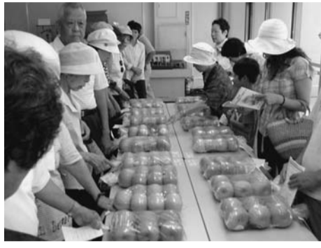
昨年の即売会のようす

多摩湖梨とぶどう等の品評会と展示即売を開催します。ぜひお越しください。 即売 午前11時から 会場 本庁舎1階市民ロビー ※即売品は数量に限りがあります。 日程 8月24日(水) 一般公開 午前10時45分~11時 問い合わせ 市民部産業振興課