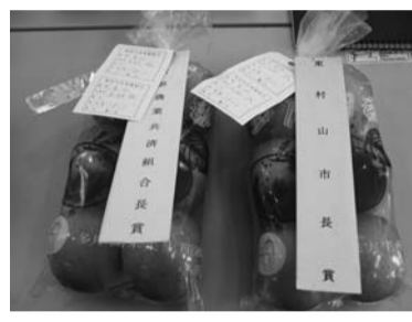
昨年の各賞を受賞した梨