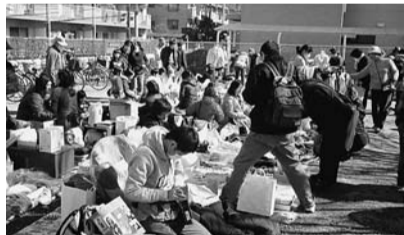
フリーマーケットのようす

ごみ減量と資源の有効利用を目的に、フリーマーケットを開催します。 日時 3月4日(日)午前10時～午後1時 ※雨天中止 開催場所 夢ハウス駐車場 ※当日は、陶器市、包丁研ぎも開催します。包丁研ぎは1丁100円、1人2丁までです。申込みが多い場合は、引き渡し日が後日になる場合があります。 ※車での来場はご遠慮ください。