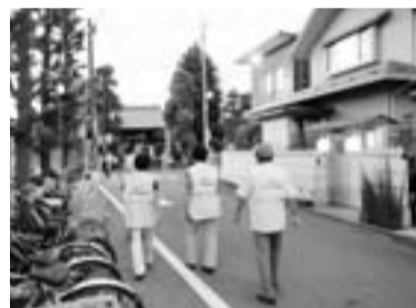
子どもたちのための地域パトロール

学校や地域の行事（地域のパトロールなど）にできるだけ参加し、地域の皆さんとの交流を心掛けています。