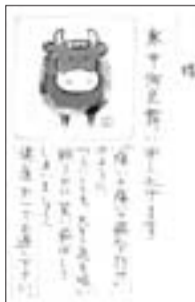
手作りの季節の便り

年齢が80歳、90歳を超えてなお、自分を律してかくしゃくと生活されている地域のかたからは、たくさんのことを学ばせてもらえます。そして多くの仲間との交流の中で、自分磨きができると思います。