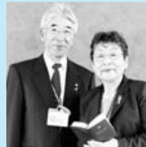
私たちも民生委員です

13町内の各丁目1名以上民生委員・児童委員はいます。また、生活福祉課でも身近な委員を紹介しています。（市のホームページから委員一覧表がご覧いただけます。）