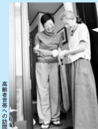
高齢者世帯への訪問

また、本人の了解を得て、市・高齢介護課、地域包括支援センター、民生委員・児童委員が情報を共有し、見守りや訪問等を行っています。