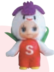
菖蒲まつりキャラクター「しょうちゃん」 キュービーストラップ

菖蒲まつりについて =市民部産業振興課 北山公園について =都市環境部みどりと環境課