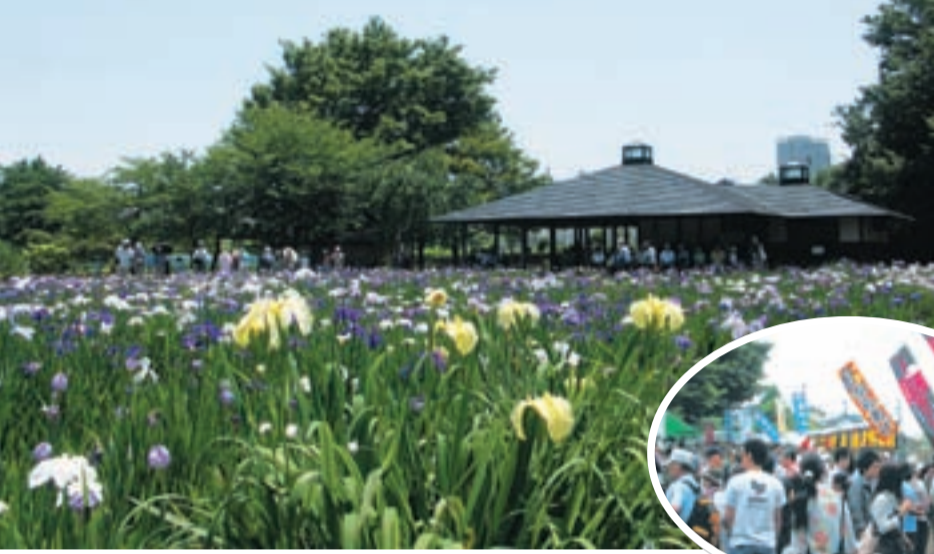
▲昨年の菖蒲まつりのようす

映画「となりのトトロ」の舞台とされる八国山緑地の南側で、新東京百景にも選ばれている北山公園には、広さ6千300㎡の菖蒲田があり、20種類、8千株(約10万本)の花菖蒲が6月上旬から開花します。 八国山の新緑や色鮮やかな花菖蒲とともに、見晴台や子どもたちの泥遊びスペース「あそびじま」などで、楽しいひとときを過ごしにぜひお越しください。 ★6月9日(土)~24日(日)は、公園内トイレの利用時間を午前7時~午後6時に延長します。 ★公園には駐車場がありませんので、ご注意ください。