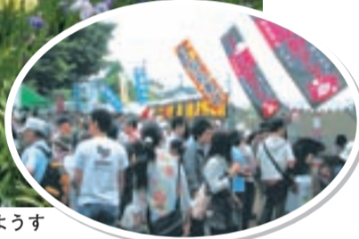
▶にぎわう模擬店のようす