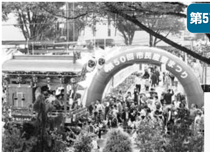
昨年もたくさんの人々にぎわう