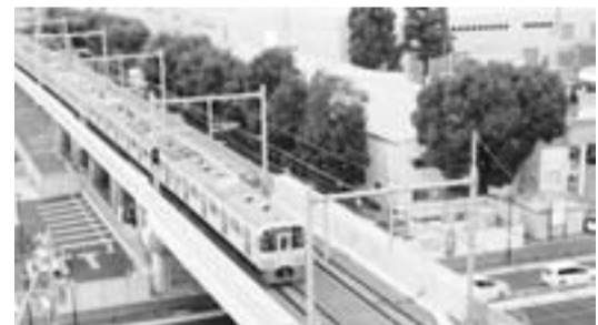
立体交差化のイメージ（写真は西武拝島線）