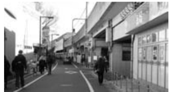
鉄道附属街路のイメージ（写真は西武池袋線）