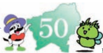
ふるさと歴史館公式キャラクター「はっく君」

みなさん、わかりましたか。答え合わせは、ふるさと歴史館へぜひお越しください。※月・火曜日休館(祝日の場合は開館し翌日が休館)