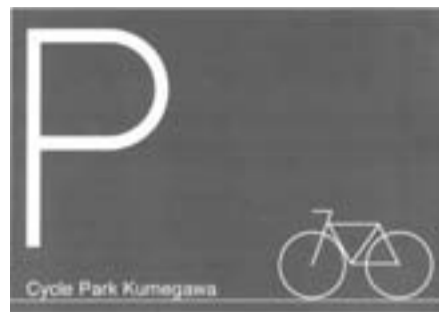
案内板イメージ図

輪場（☎396・7543） ②東村山駅西口地下・第1駐輪場（☎396・7559） 駐輪場の位置左図①・②参照 問地域安全課