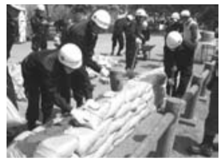
一丸となって災害時に備えます

日5月9日(金)午前10時開始 場北山公園（野口町4-50） ※車での来場はご遠慮ください。 問防災安全課