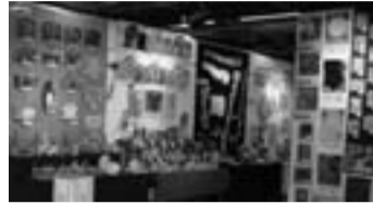
作品展テーマ「ほりおこそう ひろげよう 子供の造形」

市立小学校全15校の図画工作の授業で児童が制作した作品を展示します。 日 2月14日(土)～18日(水)午前9時30分～午後4時30分 ※2月16日(月)は除く 場 中央公民館(本町2-33-2) 問 指導室