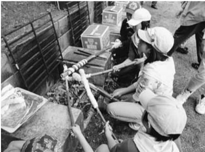
白州キャンプで仲間と一緒にパン作り

年齢の異なる子どもたちが「いのちの大切さを知り、ともに生きる!」をテーマに、自然の中での体験や社会奉仕活動を経験します。 これらの活動を通して、規範意識や自主性・協調性などを学び、豊かな人間性を育みます。また、毎年継続して参加することで、自ら積極的に地域の