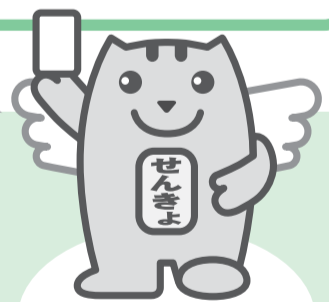
明るい選挙キャラクター「選挙のめいすいくん」

これからの国政の担い手を決める大切な選挙です。貴重な一票を大切にし、必ず投票しましょう。