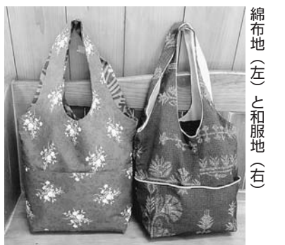
綿布地(左)と和服地(右)