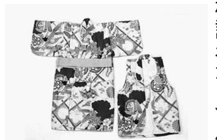
ひとつ身袷女児用長着(左)と袖無半纏(右)