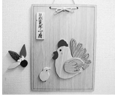
一緒に羽ばたこう

申 10月17日(月)以降の午前10時～午後4時に電話でとんぼサポーター2(☎080-5649-3844)へ(祝日を除く)