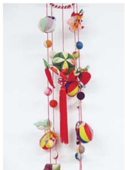
この中の1本を作ります