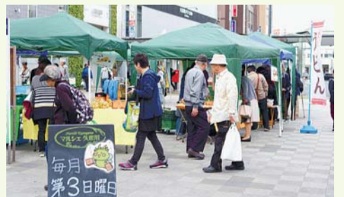
新鮮な野菜を買いに来ませんか