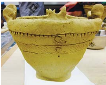
焼き上がりが楽しみです

下宅部遺跡から出土した縄文土器を見本にして本格的な土器を作ります。作品は後日、下宅部遺跡はっけんのもり(多摩湖町4-3)で、野焼きで焼き上げます。 日 2月12日(日)午後1時30分～4時30分 場 八国山たいけんの里(野口町3-48-1) 人 高校生以上のかた、先着15名 費 500円(材料費)