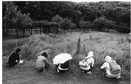
北山公園と八国山を比べてみよう