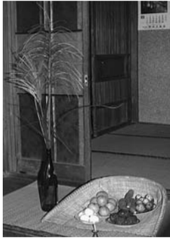
十五夜は芋名月ともいわれ、芋を供えます