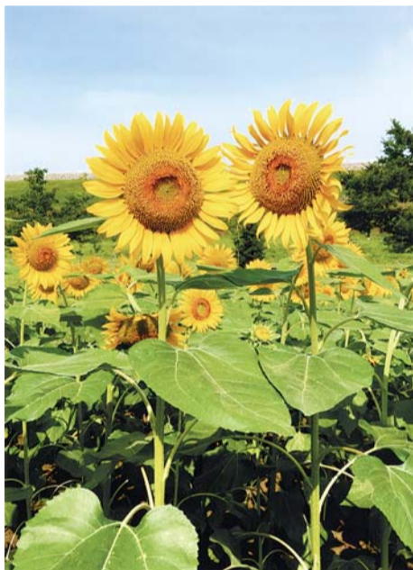
「笑顔がいっぱい」(風の広場)