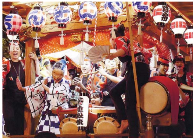
「ドンドンヒヤララ」