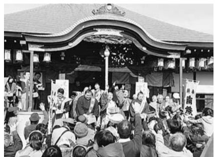
大善院 節分豆まき

申込 1月17日(水)午前10時から電話又は直接「産業・観光案内コーナー」(☎042-395-5110)へ(月曜日を除く)