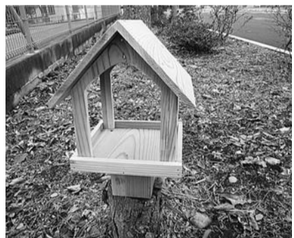
自宅でバードウォッチングを楽しもう

日 2月4日(日)・10日(土)・24日(土)・25日(日)午前9時30分～11時30分