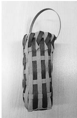
ペットボトルホルダーにもなります