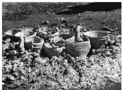
焼き上がりを楽しみます

下宅部遺跡から出土した縄文土器を見本にして本格的な土器を作ります。作品は後日、下宅部遺跡はっけんのもり(多摩湖町4-3)で、野焼きで焼き上げます。