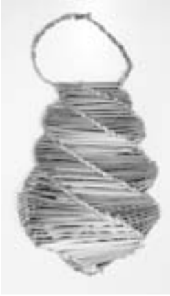
麦わら細工(虫かご)