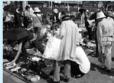
欲しかった物が見つかるかもしれません