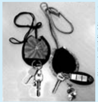
おしゃれで機能的なカギ袋

申 電子申請又は往復はがきに必要事項を明記し、6月12日(必着)までに夢ハウス(〒189-0023美住町2-11-32)へ