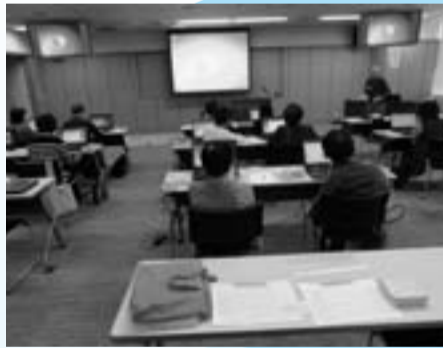
マルチメディアホール