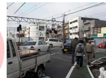
東村山第1号踏切（大踏切）

踏切による交通渋滞、緊急車両の通行の妨げ、踏切内での交通錯綜、地域分断などが生じています。