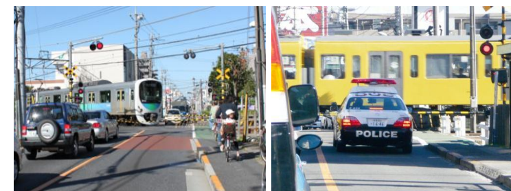
久米川第2号踏切（府中街道）