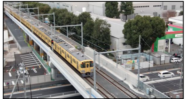
立体交差化のイメージ（西武拝島線）

市では、東村山駅付近の連続立体交差事業とあわせた駅周辺まちづくりの課題を整理し、「まちづくり基本計画」としてまとめるために検討を進めています。