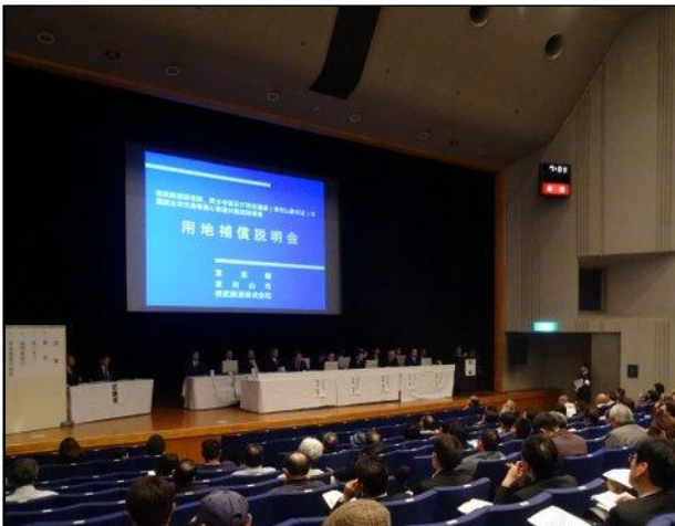
用地補償説明会の様子

平成26年3月25日、27日に連続立体交差事業及び鉄道附属街路事業の用地補償説明会を開催致しました。