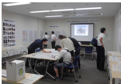
オープンハウスの様子