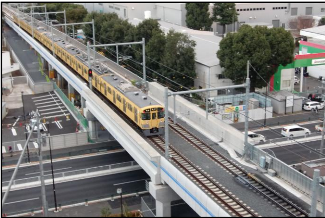
立体交差のイメージ 西武拝島線（萩山駅⇄小川駅間）

「東村山駅周辺まちづくり基本計画」とは、東村山駅付近の連続立体交差事業とあわせた駅周辺まちづくりの課題を整理し、まとめたものです。