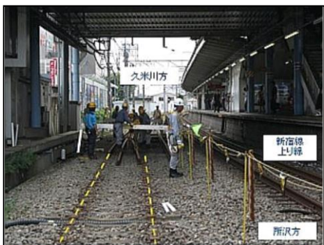
第2工区 線路設備撤去の様子