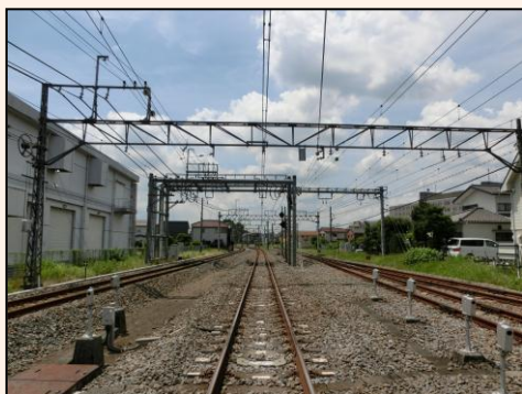
第1工区 鷹の道の踏切付近の現在の様子

第1、第4工区については、現在、工事着手に向けた準備を進めております。工事に進捗がありましたら、適宜お伝えします。