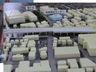
府中街道付近から鷹の道 (イメージ)

今後も、東村山駅周辺まちづくりの状況・動向は、このニュースでお知らせしていきます。東村山駅周辺での「こんなところが良い…」、「こうすればもっと良くなるのに…」など、ご意見ご要望がありましたら下記までどうぞ。