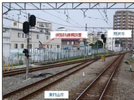
第3工区 設置された線路防護柵

第2工区では東村山駅部の工事に向けて仮囲いを設置する等の準備工事を進めています。また、工事に支障する線路設備の撤去もあわせて着手しています。