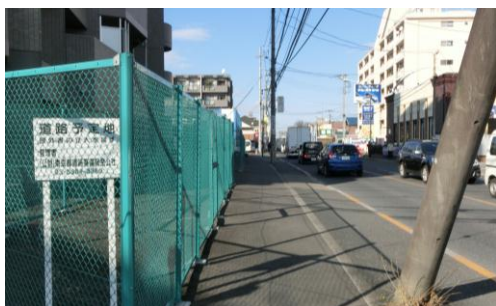
現在の状況（野口橋付近）

東京都が施行する都市計画道路3・3・8号線の事業が進んでいます。新青梅街道からさくら通りまでの区間については現在事業が進められており、更にさくら通りから都県境までの区間（右図）についても平成28年3月15日に事業認可が取得されました。こちらの区間は平成33年度末までの認可期間となっております。