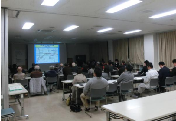
まちづくり協議会の様子

現在実施されている連続立体交差事業を始めとした、東村山駅周辺の都市計画事業の概要や、これまでの東村山駅周辺まちづくりの取り組みなどについてご報告し、質疑応答を行いました。