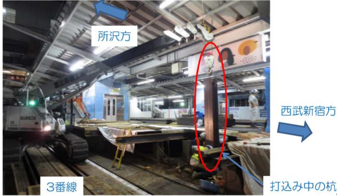
仮設地下通路部分の杭打ち状況写真