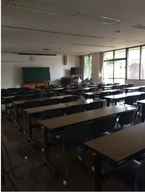
⑩ 会議室 (第1会議室と第2会議室をつなげた場合)