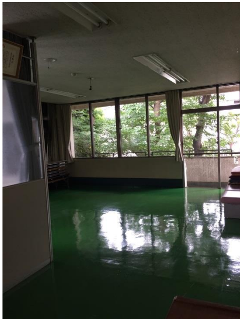
⑪ 集会室 兼 活動室