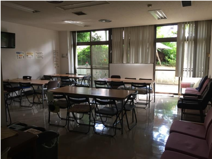
⑤ 福祉作業所休憩室