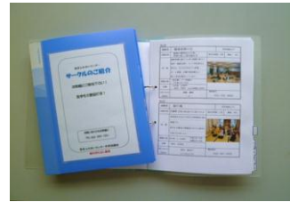
「サークルのご紹介」冊子

◎ふれあいセンターには様々なサークルが登録され皆さんが楽しく活動しています。 あなたも趣味の世界を広げ、一緒に楽しんでみませんか！ 登録団体を紹介した「サークルのご紹介」冊子は、窓口 に常備してあります。興味のある方はご参照ください。