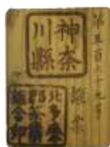
北多摩郡茶業組合証票