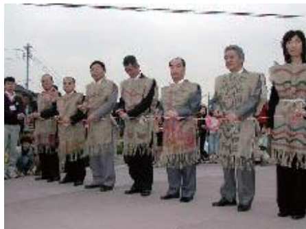
お誕生日会テープカットの様子

こうして「下宅部遺跡はっけんのもり」は産声をあげ、2012年には、8歳のお誕生日を迎えることができました。その成長の過程では、育てる会を中心とした市民と歴史館による協働での清掃や管理、イベントや体験学習などの諸活動によって支えられてきたのです。(石川)