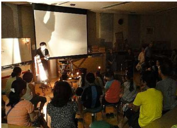
東村山のこわ〜い話

今年も節電の夏になりますが、家の電気を消して、八国山たいけんの里でお過ごしください。