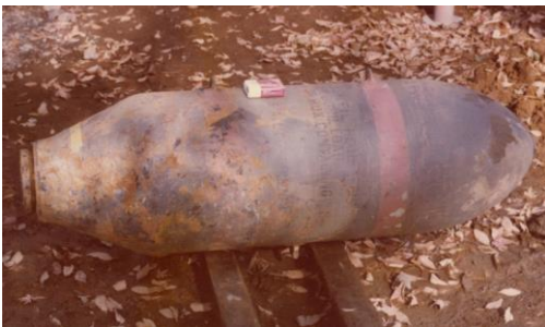
東村山に投下された不発弾

東村山町（現東村山市）には村山貯水池下堰堤 むらやまちよすいちしもんてい があり、空爆によって堰堤が決壊した場合は下流の住民を避難させなければならず、堰堤決壊時の警鐘打方 げいしょううちかた 及避難訓練なども行なわれました。また、村山貯水池防護工事のため、西武鉄道村山線狭山公園駅に引込線がつくられ、羽村山口軽便鉄道と接続してコンクリートや玉石などの資材を運んでいました。