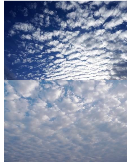
上 いわし雲 下 ひつじ雲