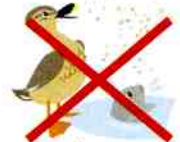
生きものへの エサやりはダメ