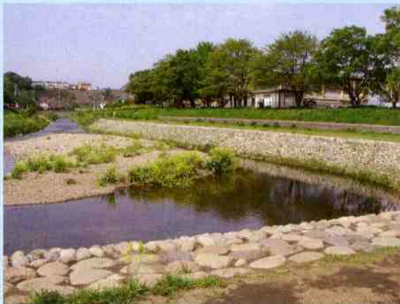
柳瀬川清瀬橋下流ワンド(平成17年度整備)

河川の整備としては、現在（平成20年度）主に柳瀬川の空堀川合流点付近（清瀬市中里）、空堀川の奈良橋川合流点付近（東大和市奈良橋）の工事を行っています。また、空堀川の高木橋から下流は河川が整備され、河川沿いに遊歩道が整備されています。