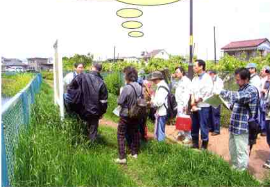
空堀川東芝中橋付近