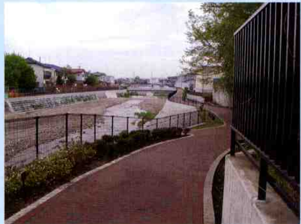
空堀川高木橋下流(平成19年度整備)

「東京都建設局河川整備計画」のURL： http://www.kensetsu.metro.tokyo.jp/kasenseibikeikaku/index.html