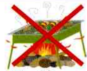
バーベキュー 直火はダメ