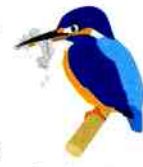
ゴミをくわえた カワセミ