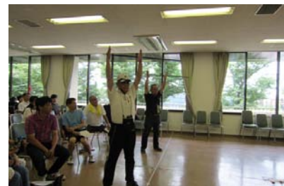
両腕で筒を高く上げながら、鼻から息を吸います筒をゆっくり下げながら、口から息を吐ききります