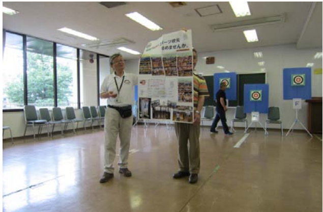
★東村山市スポーツ吹き矢協会のPR★

スポーツセンターの会議室で水曜日の午前中木曜日の午前中活動をされているので興味のある方は気軽にぜひ 行ってくださいね！