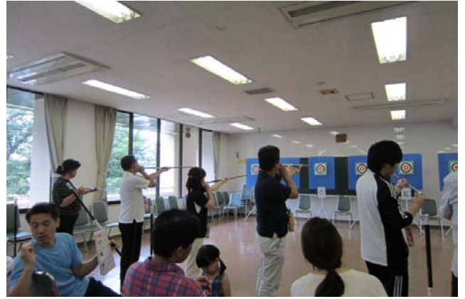
精神の集中☆ 的の中の一点に集中！