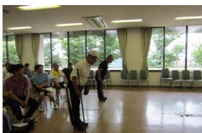
的に向かって一礼します。