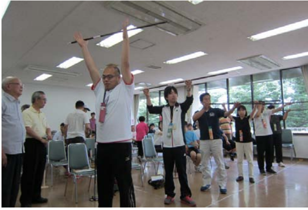
さあ～教わった通りに両手をしっかりあげて息を吸って…。吐いて…。