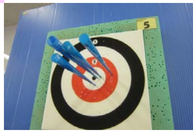
こんなに当たるようになりました。

スポーツセンターの会議室で水曜日の午前中木曜日の午前中活動をされているので興味のある方は気軽にぜひ 行ってくださいね！