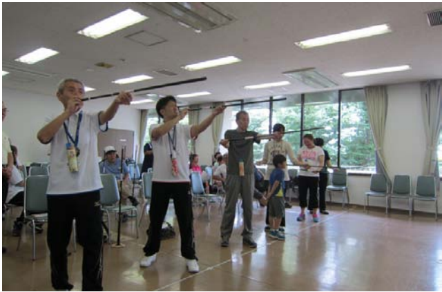
表情も こんなに真剣な顔

こうして、繰り返し呼吸を整え順番で4ラウンド吹いていきます。4ラウンドの合計点で、勝負を決めていきます。最初は 的まで届かなかつたり的に当たっても 真ん中に当たらなかつたりと…。でも、スパーンっと的に刺さる感覚はとっても気持ちがよく気が付いたら…。